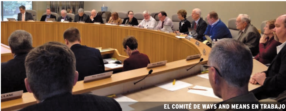
EL COMITÉ DE WAYS AND MEANS EN TRABAJO